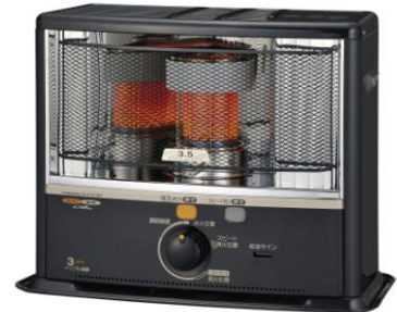
SX-E3511WY 定価 31,290