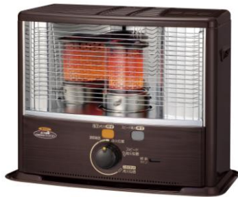
SX-E2911WY 定価 22,890