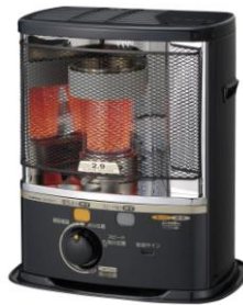
SX-E2811Y 定価 29,190